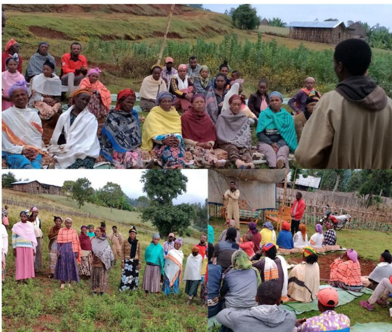
Utbildning för självhjälpsgrupper i Chench.

Det är spännande att ta del av rapporterna om självhjälpsgrupper. Hundratals kvinnor deltar i projekten på olika nivåer och i olika delar. För några kvinnor kan det betyda att de får hjälp med att avla fram två lamm i stället för ett enda. De är förpliktigade att ge det första "tvillinglammet" till en annan kvinna som på samma sätt föder upp två lamm och i sin tur lämnar ett vidare. Samtliga kvinnor som deltar i grupperna får grundläggande utbildning i genderfrågor om kvinnors och flickors rättigheter med målet att stoppa utnyttjande och våld mot dem samt ge dem en plattform för att delta i och fatta egna beslut. Man har dessutom valt ut några kvinnor till att fördjupa sig specifikt i strategier och ledarskap.