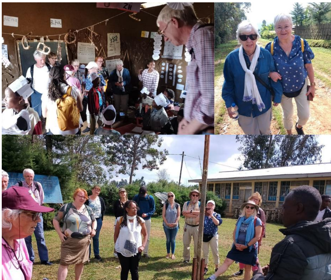
Besök på econod Chance classes i Chencha