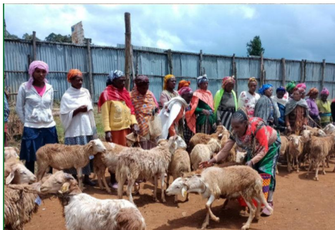
Utdelning av får till kvinnor i självhjälpsgrupperna.

Det är sedan länge väl känt att flickors och kvinnors utbildning är en nyckelfaktor för utveckling och förbättrade levnadsvillkor för alla. Kvinnor som får stöd i att utveckla familjens självförsörjning genom bättre utsäde och uppfödning av boskap går vidare till att sälja av sitt överflöd och därigenom tjäna pengar till barnens skola och nödvändiga utgifter. Lägg därtill stöd av lokala sociala och finansiella myndigheter, lokalt program för jordbruksutveckling och bildande av mindre kvinnokooperativ där kvinna lär av kvinna och för vidare sina kunskaper. I självhjälpsgrupper tränas alla deltagare i konflikthantering i grupper och i hemmen. Det blir ringar på vattnet och en positiv framtidsspiral som tjänar alla; kvinnorna, barnen, fäderna, hela familjen, lokalsamhället och förhindrar att barn och fäder utan framtid flyttar till Addis Abeba och hamnar i slavarbete och misär. Sedan länge har de organisationer vi samarbetar med, HCE och WSG, förlagt en del av sitt förebyggande arbete till Chenchä i södra Etiopien, då det visat sig att många gatubarn i Addis Abeba kommer från det området.